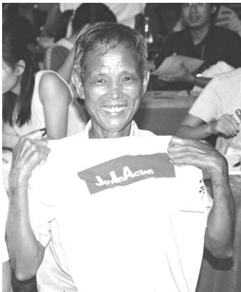
多くのキャンパーに愛された、藤橋村 村長