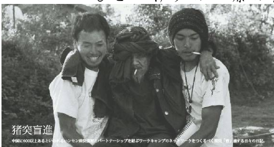
猪突盲進 中国に6000人といわれるハンセン病患者の約10パーセントを占めるワークキャンプのメンバーをつくるべく「猪突盲進」は活動する日々を日記

電話を受けると、重慶からだだった。重慶は四川省の隣だ。彼は桂林出身で、かつて桂林ピンシャン村キャンプのうわさを聞いたことがあるという。大学生になった今年、彼は友達十名を誘って桂林の近くのハンセン病快復村に行きたいという。四川に近い彼に地震後の復興キャンプを開催できるかをきいてみると、答えは、「いまは無理」だった。政府が素人のボランティアが被災地に入ることを禁止しているという。理由は、 1) いまはまだ余震があるので危険なため 2) 伝染病の流行が考えられるため 政府は、壊滅した街を街ごとそっくり引越すことを考えているとか。その場合、たくさんのボランティアが必要になる。まず声がかかるのが重慶の大学だろう。その際、JIAも絡めるかもしれない。 五月三十日 MIXI日記より