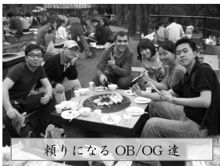
頼りになる OB/OG 達