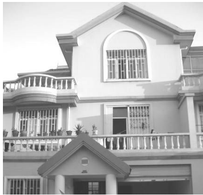
ヨーロピアン家屋風の雲南省のオフィス

政府機関・貴州省疾病予防治療センターはキャンブ参加者がハンセン病快復村に入り込むことで何か事故でも起こればと心配し、結局キャンブは中止となった。