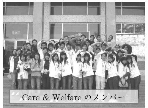
Care & Welfare のメンバー