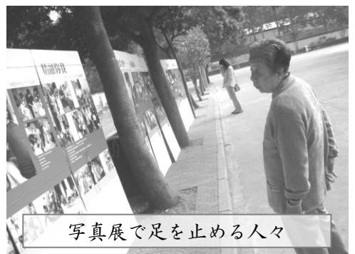
写真展で足を止める人々